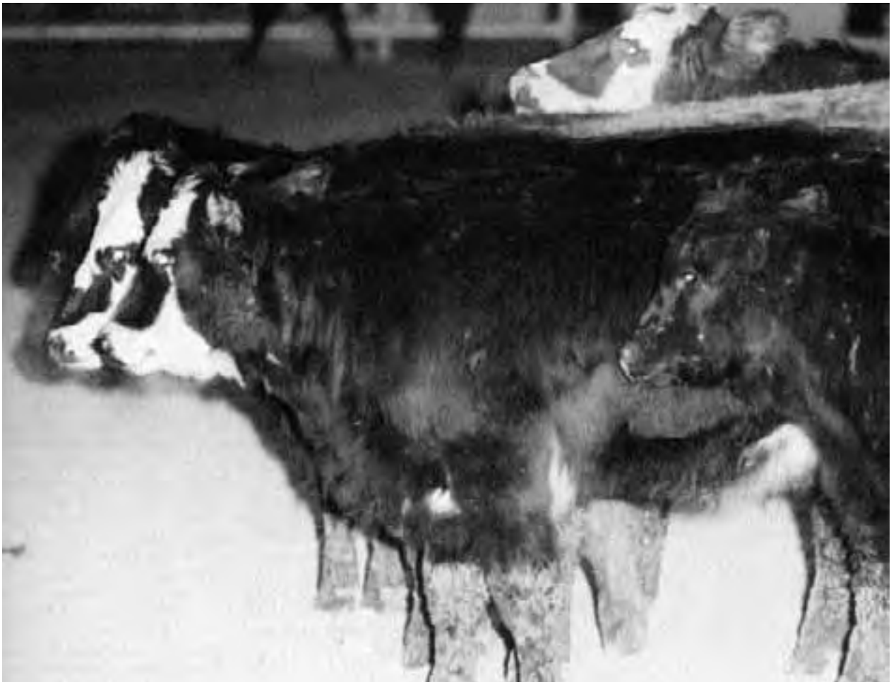
Aprender a diferenciar el ganado es más simple cuando son de muchos colores, pero cuando son similares, busque una característica única (remolinos del pelo o manchas de estiércol).